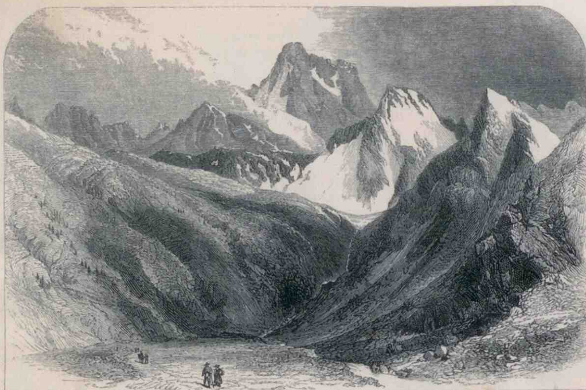
MONTE VISO, FROM THE NORTH.

che i puntini stagliati sulla cresta sommitale della Gran Becca non erano le sagome della guida Jean-Antoine Carrel e compagni, saliti dalla Cresta del Leone per onorare la Valle d'Aosta e l'Italia, ma le silhouette di tre guide straniere e di quattro alpinisti guidati da Whymper. Il povero Carrel aveva dovuto arrendersi poco oltre il Pic Tyndall. A un passo dalla cima, come in ogni gara che si rispetti. La trama del romanzo prevede un finale drammatico e ammonitore: Whymper, il giovane d'oltre Manica che arrampica per orgoglio e piacere, va in qualche modo punito. La punizione supera ogni misura, con la morte di quattro compagni sulla via del ritorno: Hudson, Hadow, Douglas e Croz. I tre